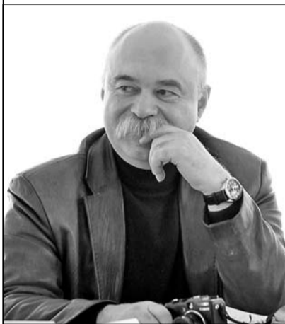
Главный редактор "биржевых" изданий