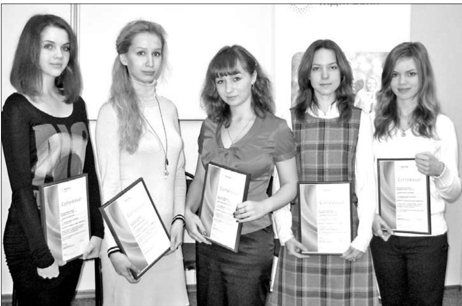
Студенты, получившие стипендии МДМ банка

"Каждый год участники нашей программы становятся все более подготовленными к конкурсным заданиям, сме-