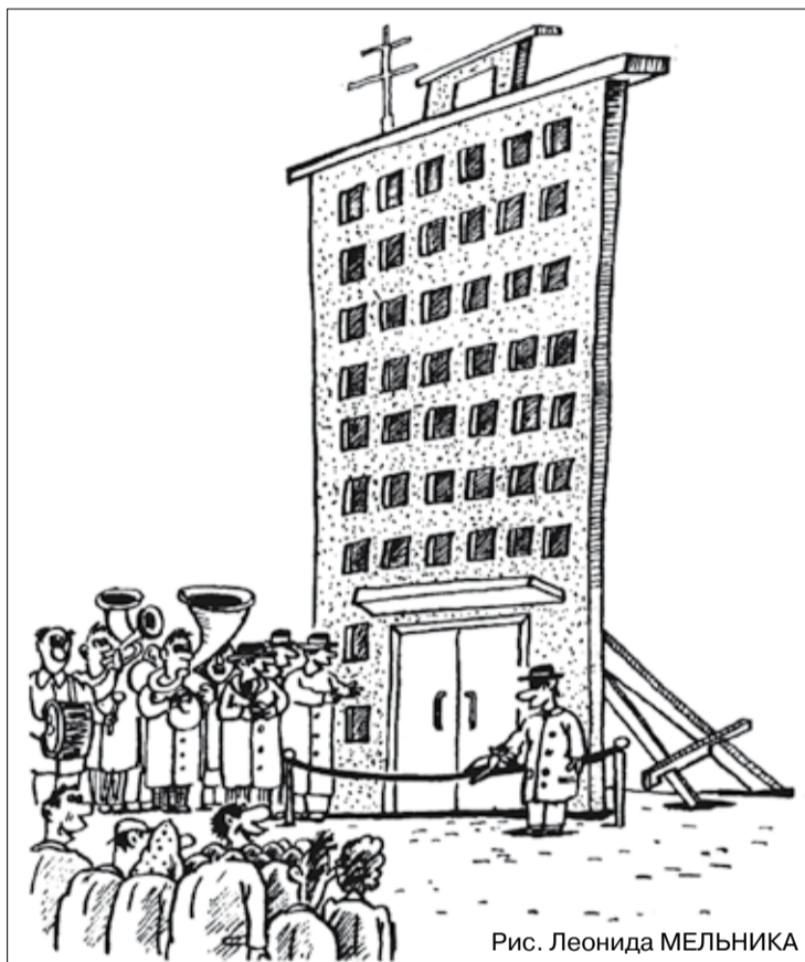
Рис. Леонида МЕЛЬНИКА

— вам построили коттедж, но получилось не совсем то, что вы